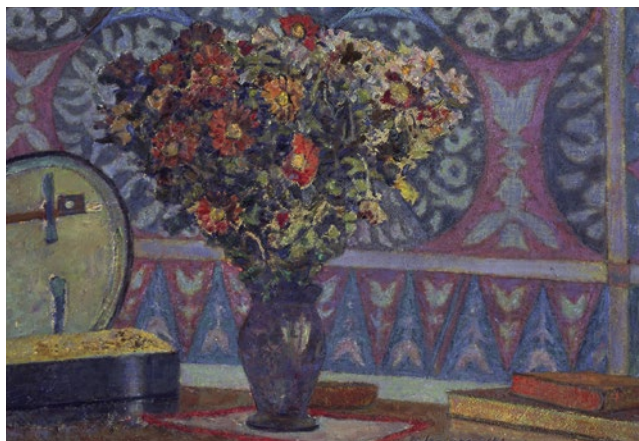
Stanisław Szczepański, Kwiaty na tle makaty , 1945, MASP (12)