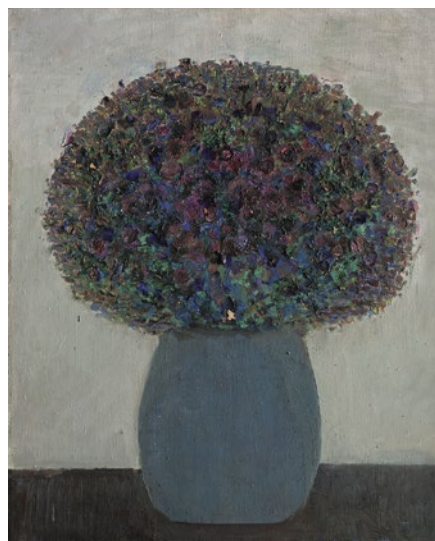
Irena Wilczyńska, Bukiet I , 1976, MASP (57)