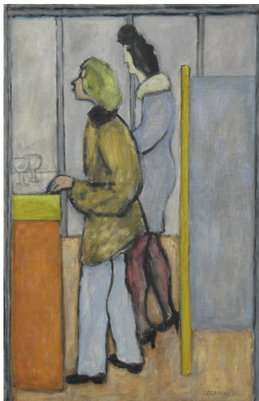
Józef Czapski, Café Montmartre , 1975, MASP (23)