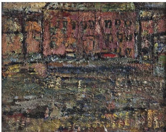
Jan Cybis, Przystań rybacka , 1962, MASP (20)

studentów o Cybisie i Nachcie powraca wizerunek pedagoga, który jest autorytetem, stale rozbudza ciekawość odkrywania sztuki i zachęca do własnych poszukiwań.