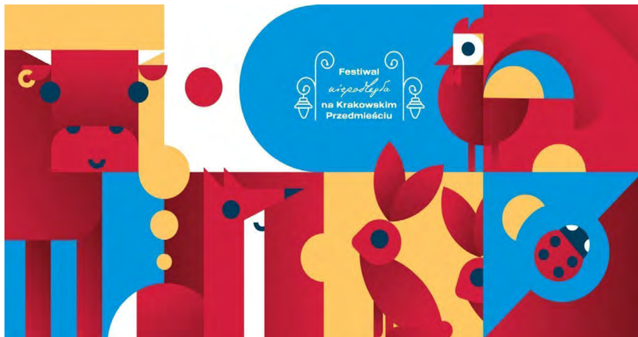
Grafika namiotu dziecięcego: Aleksander Domański

ŚWIĘTUJMY RAZEM! - SCENA DZIECIĘCA Dziedziniec Akademii Sztuk Pięknych w Warszawie, Pałac Czapskich – siedziba ASP i Oficyna Sztuk Pięknych ASP w Warszawie