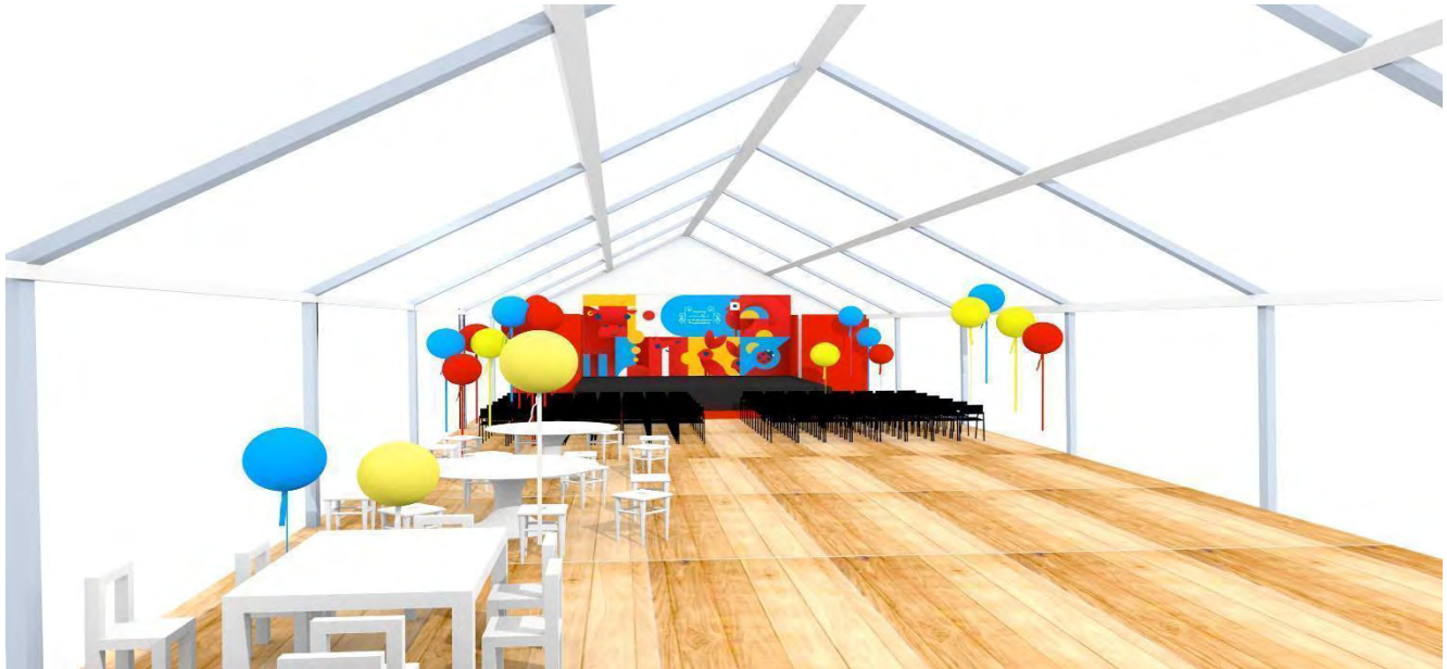
Projekt scenografii: Anna Mioduszewska