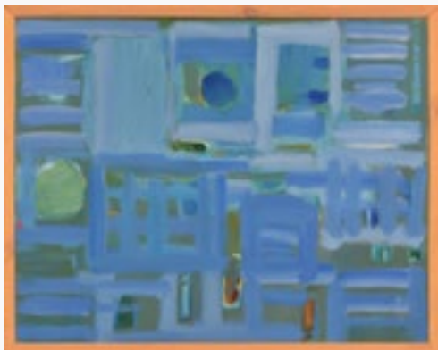
KRETA olej na płótnie, 92x73, 2020