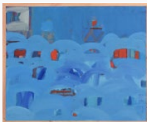
MAURITIUS olej na płótnie, 100x81, 2020