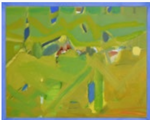
ORINOKO olej na płótnie, 92x73, 2020