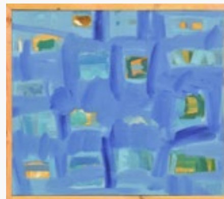
NAD NIEMNEM olej na płótnie, 90x80, 2021