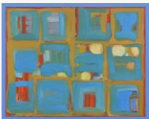
NA BRZEGACH NILU olej na płótnie, 92x73, 2021