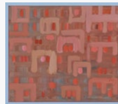
VALLETTA olej na płótnie, 90x80, 2020