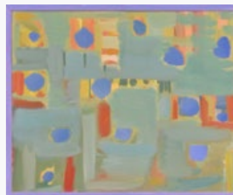
MARAMURESZ olej na płótnie, 90x73, 2019/20