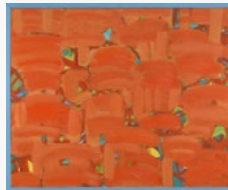
HOI AN W ŚWIĘTO TẾT olej na płótnie, 100x81, 2021