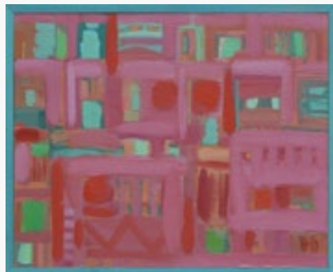
LUANG PRABANG olej na płótnie, 90x73, 2019