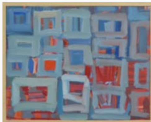
MIASTO PANAMA olej na płótnie, 92x73, 2020