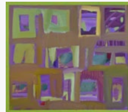
W GÓRACH TRODOS NA CYPRZE olej na płótnie, 90x80, 2021