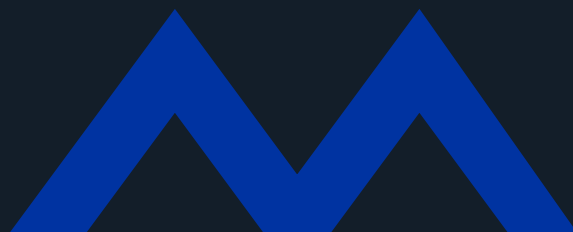
screen / zone 5 Engraved in Memory

Ekspozycja dzieli się na 5 głównych stref, każda z nich dedykowana jest innemu zagadnieniu związanemu z historią pracowni kopistów. Do projektu zaprosiliśmy autorytety swoich dziedzin, powierzając każdą ze stref osobom, które się w danym temacie specjalizują. Dzięki temu powstał unikalny i autorski content ekspozycji. Współautorkami wystawy są Panie: