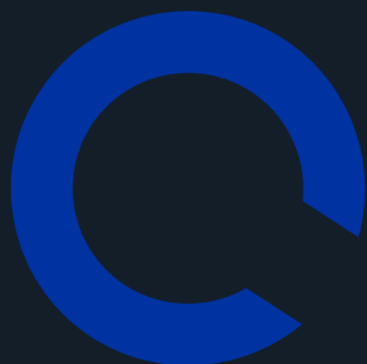
rotunda / zone 2 The bialystok ghetto 1941-1944 & The Artists of the Copy-Making Studio