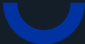
semicircle / zone 1 I open my eyes, there's no one