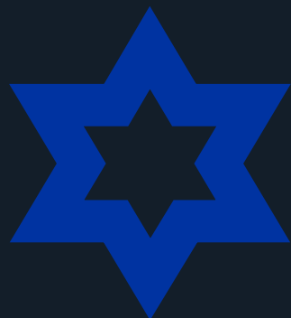
star / zone 3 The Yellow Badge